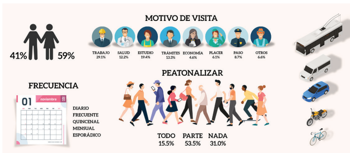
Figura 2. Caracterización de los visitantes al centro histórico de Toluca

Referente al tipo de vehículo de llegada, 59.6% lo hace en autobús, 16.2% de forma peatonal, 10.6% a través del automóvil, 7.1% usa la motocicleta, 4.0% se desplaza en bicicleta, 1.5% usa el transporte colectivo y solo 1% emplea taxi. Los cinco principales motivos para visitar el centro son 29.1% trabajo, 19.4% estudio, 13.3% trámites, 12.2% salud y 8.7% de paso. La mitad de estos viajes corresponden a trabajo y estudio. Los resultados señalan que 39.2% corresponde a visitas diarias y 18.5% tiene visitas frecuentes, entre tres y cuatro veces por semana, esto equivale a la mitad de los viajes, 57.7% son visitas recurrentes y pendulares (Figura 2).