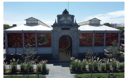
Imagen 2. Cosmovital

Las encuestas se aplicaron en días laborales, durante octubre de 2022, a 200 personas con un error estadístico de 10% y un nivel de confianza de 95% en dos ubicaciones específicas: Cosmovital (Parque de la Ciencia Fundadores) y en la intersección de las calles López Rayón e Hidalgo, ambos sitios se distinguen por el alto volumen de personas, vehículos privados y transporte público que confluyen en ellos y la concentración de actividades y usos mixtos (Imagen 2).