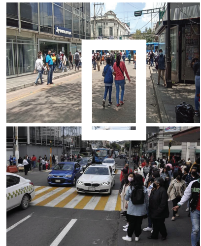
Imágenes 3a y 3b. Fotogramas del Centro Histórico de Toluca

De acuerdo con la capacidad de transporte de los vehículos en función, por cada 100 personas que arriban al centro de Toluca, se utilizan dos autobuses, nueve automóviles, siete motocicletas y cuatro bicicletas. El medio principal y menos eficiente es el automóvil; visto de otra forma, se necesitan 18 motores para transportar estas 100 personas. Su desglose corresponde a dos autobuses que transportan 66 pasajeros, 21 automóviles con 27 personas, una motocicleta con un usuario, dos bicicletas y, finalmente, 16 peatones (Imágenes 3a y 3b).