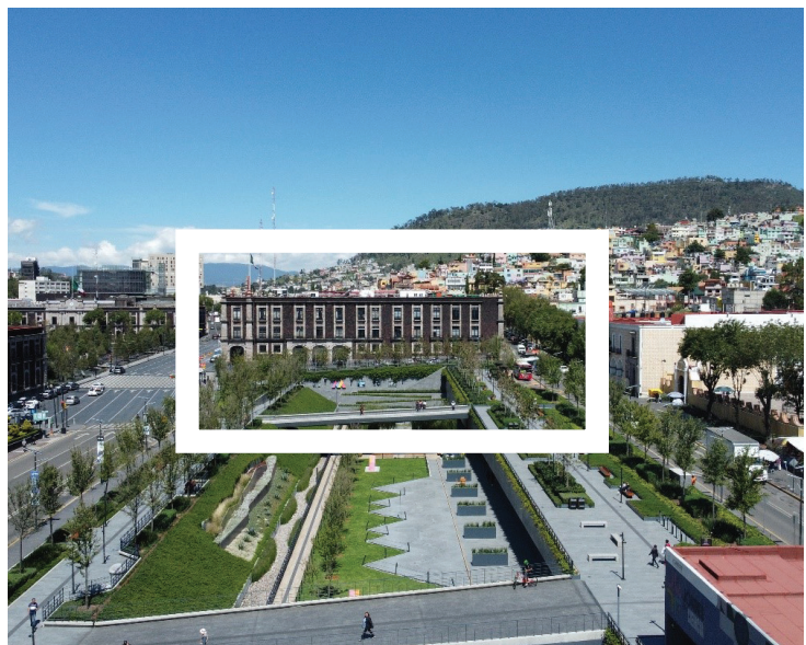
Imagen 1. Parque Fundadores

Originalmente, el centro de Toluca correspondía a la Plaza de los Mártires, aquí se estableció la ciudad y su crecimiento posterior; hoy en día, representa el centro de operaciones que concentra gran parte de la actividad política, administrativa, comercial y de servicios y es cruce obligado para acudir a distintos lugares de la periferia o cruzar hacia otros destinos mexiquenses. La cantidad de actividades y motivos de viaje hacia esta zona en particular ocasiona un gran desplazamiento de personas, vehículos particulares, transporte público y requerimientos de todos los servicios, lo que provoca un caos inducido por la misma ciudad (Imagen 1).